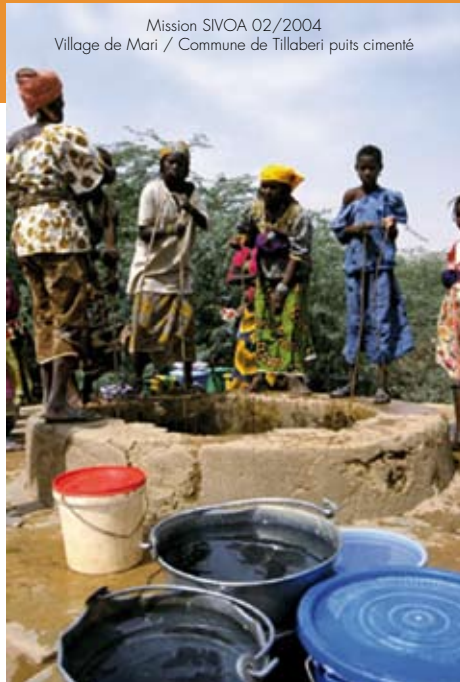
Mission SIVOA 02/2004 Village de Mari / Commune de Tillabéri puits cimenté

Pour le Syndicat de l'Orge, le développement durable n'est pas une mode, c'est un défi qu'il a décidé de relever en poursuivant son action dans le cadre du programme Peodd (programme éducatif et opérationnel de développement durable).