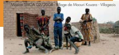
Mission SIVOA 02/2004 - Village de Maouri Kouara - Villageois