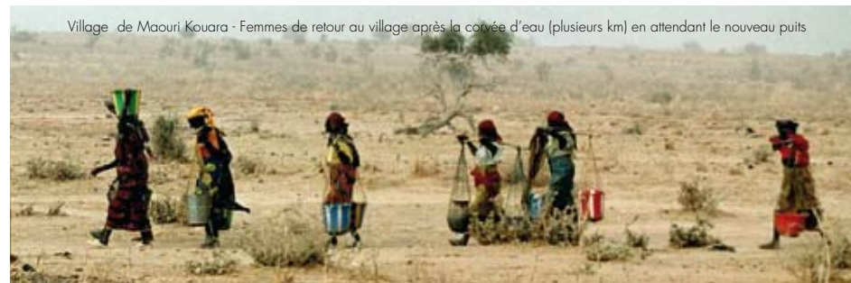
Village de Maouri Kouara - Femmes de retour au village après la corvée d'eau (plusieurs km) en attendant le nouveau puits

Véritable démarche de développement durable, l'intérêt de ce projet réside dans une implication totale de la population locale qui identifie et choisit ses priorités d'action, permettant une collaboration sur le long terme.